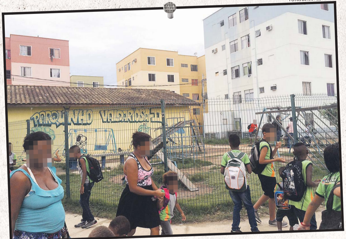
A área de recreação do Parque Valdariosa, em Queimados: local foi palco de dois homicídios

— É difícil viver com a violência à sua porta. Não consegui suportar — conta uma mulher que decidiu abandonar o conjunto no fim do ano passado.