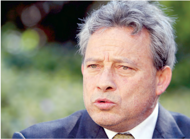
DESPENALIZAR. Ricardo Soberón, ex zar antidrogas en Perú, señala como gran fuente de exportación el trapecio amazónico hacia Europa

laboratorios clandestinos en el VRAEM y cada vez son más comunes las narcopistas en toda esta zona y en la selva central.